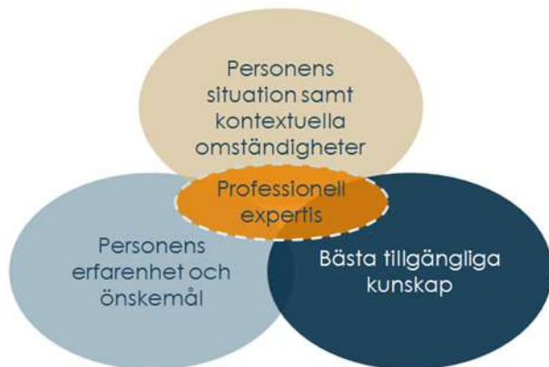
Figur 1: Evidensbaserad praktik i socialtjänsten. Socialstyrelsens kunskapsguide (Socialstyrelsen 2016).