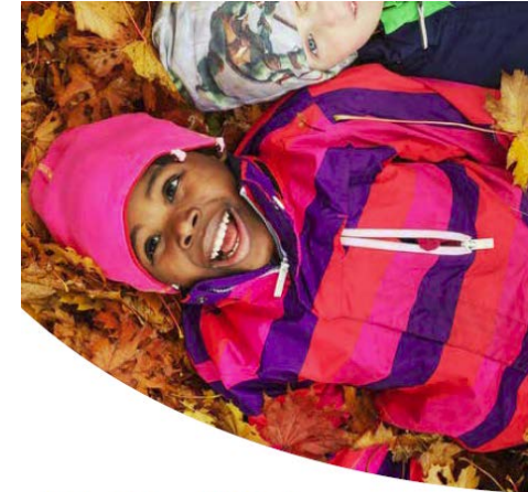
Mänskliga rättigheter i styrning och ledning