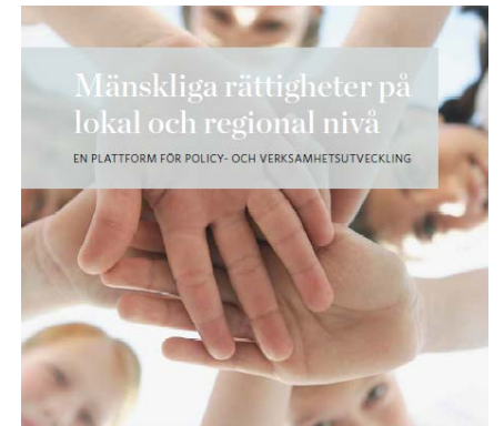
Mänskliga rättigheter på lokal och regional nivå

EN PLATTFORM FÖR POLICY- OCH VERKSAMHETSUTVECKLING