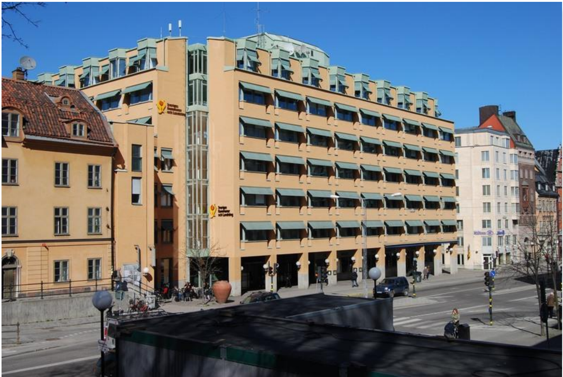
SKL-byggnaden vid Slussen i Stockholm.