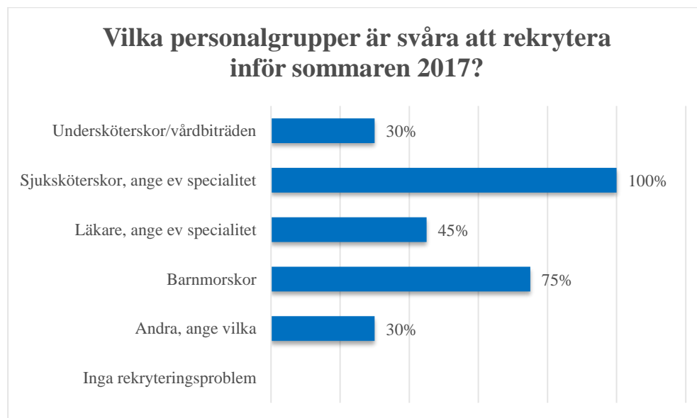
Tabell 2. Vilka personalgrupper är svåra att rekrytera inför sommaren 2017?