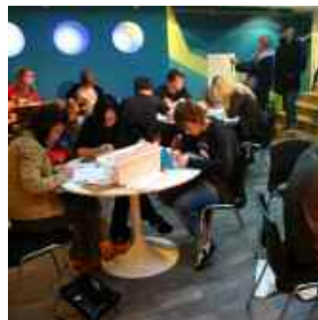
På Uno i centrala Karlstad styr ungdomarna själva.

Nu har Uno varit öppet i drygt ett år, ett år med många aktiviteter och många besökare – men utan Karlstads ungdomsfullmäktige hade inte Uno funnits.