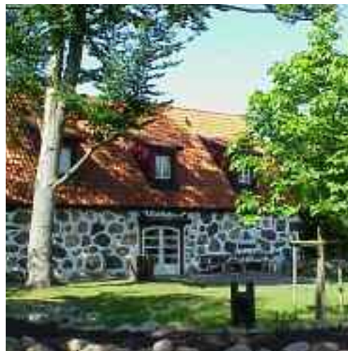
Miljöverkstaden finns centralt i Helsingborg. Där får barn och vuxna handfast miljöutbildning.

Miljöverkstaden ger handfast miljöundervisning utanför skolan, men ger också barnen en inblick i hur närsamhället fungerar, det närsamhälle som barnen en dag ska ta över.