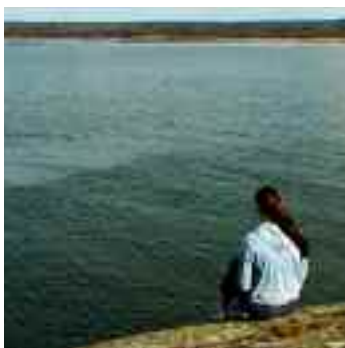
När myndigheter samverkar nås de bästa resultaten i arbetet mot kvinnovåld och hedersrelaterat våld.

skyddat boende för kvinnor och deras barn, där barnen också erbjuds krissamtal, dels en öppen mottagning där man tar emot kvinnor för samtal efter tidsbokning.