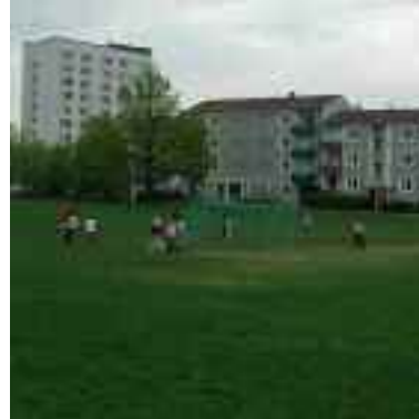
Boendemiljön har en nyckelroll i folkhälsoarbetet.

Folkhälsoarbetet är en del i kommunens arbete för medborgarnas hälsa och livskvalitet. Många är berörda och medverkar i ett arbete som tar sig många olika uttryck och som skär genom kommunens alla verksamhetsområden (se faktaruta).