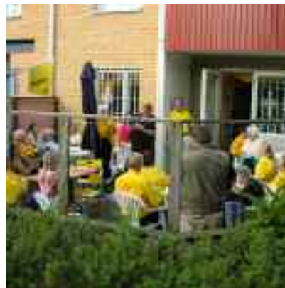
Gula Träffpunkten i Hageby är navet för verksamheten.

Ett annat projekt har varit att bygga om skolgården, den eldsjäl som hade hand om det ordnade teckningstävling bland eleverna på skolan och fick en arkitekt att gratis rita den nya skolgården.