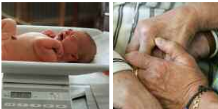
Att mäta och väga ett nyfött barn är lätt – men sedan då?

Sedan år 2000 arbetar Östersunds kommun med välfärdsbokslut. Modellen har utvecklats av Sveriges kommuner och landsting och Statens folkhälsoinstitut tillsammans med ett antal kommuner, bland dem Östersund.