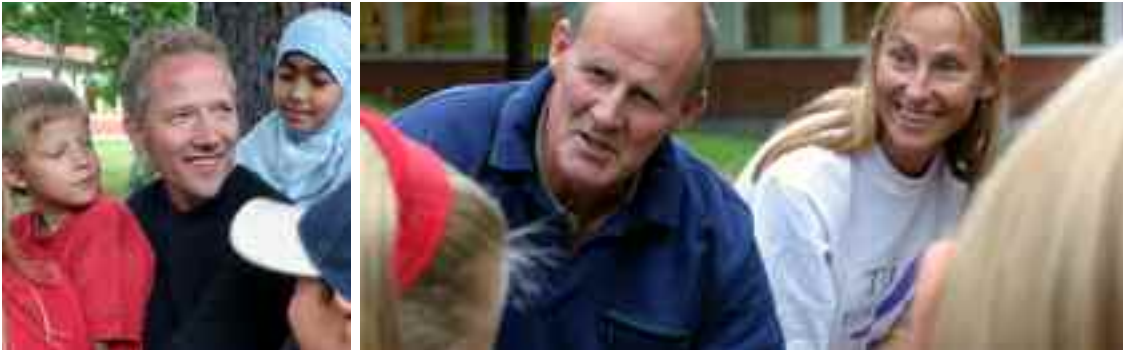
Många kommer på studiebesök för att se vad man åstadkommit i Falun.

man kunnat anställa fler pedagoger, flera kurser pågår, ytterligare utbildning startar i höst och det är till och med kö till utbildning under 2007 och 2008.