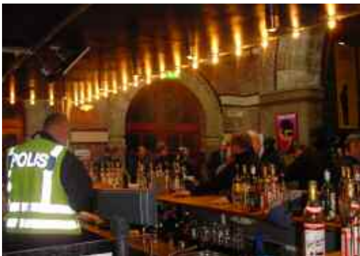
Ökad polisen närvaro minskar krogvåldet.

Strategin heter "En drogfri framtid" och omfattar en vision, en rad mål, insatsområden och åtgärder som ska genomföras från 2002 till och med 2010.