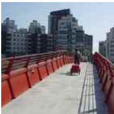
Med 60 mil cykelvägar finns det ingen anledning att lämna cykeln hemma.

Västerås är en riktig cykelstad och har tillsammans med Svenska Cykelsällskapet startat ett så kallat TMF-projekt, där TMF står för Träning, Motion, Fritid. Målet är att få Västeråsborna att börja motionera i vardagen.