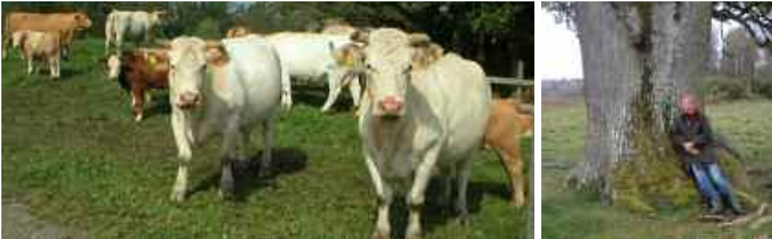
Under ekarna får både människor och djur sinnesro.