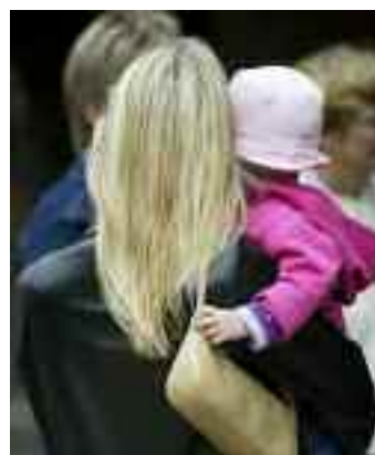
Arbetet för kvinnofrid i Trollhättan står modell för arbetet med en ny kvinnofridslag.

Andra pusselbitar är kommunala kriscentrum för kvinnor, och kommunala kriscentrum för män. Inom socialtjänsten, äldre- och omsorgsverksamheten finns utbildade kvinnofridsinstruktörer. För att öka kunskapen om hedersrelaterat våld har en handbok tagits fram, och dessutom får skolans personal utbildning i ämnet.