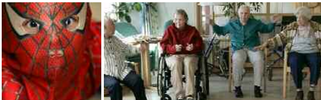
Folkhälsa inbegriper folk i alla åldrar.

– Ett välfärdsbokslut kan läsa av vad vi åstadkommer i barnomsorg, skola, äldreomsorg, fritid, miljö, kultur och så vidare. På så sätt kan olika insatser samordnas, resurser kan styras mellan och inom förvaltningar och kommundelar så att det ger bäst utbyte för att nå uppsatta mål.