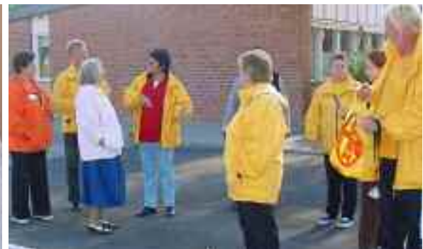
Omkring 100 människor – och enstaka hundar – är eldsjälar i Hageby.