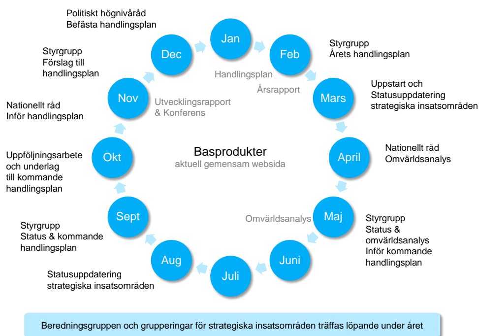
Figur 2. Handlingsplanens årsprocess.

Arbetet med att genomföra handlingsplanen följer en årlig process enligt förslagen modell i figur 2. Syftet är att skapa en struktur för framförhållning vad gäller löpande planering, genomförande, uppföljning, styrning, rapportering och arenor för dialog.